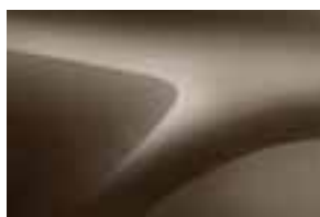
VISION SMEĐA (CNM)