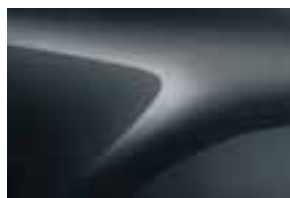
COMETE TAMNOSIVA