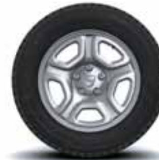
NAPLATCI 16" FIDJI