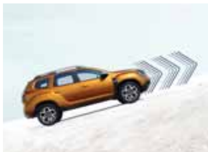
POMOĆ PRI KRETANJU NA UZBRDICI

Na označenom ili nepoznatom putu, Dacia Duster uvijek ima odgovarajuće rješenje: pomoć pri kretanju na uzbrdici svladava uzvisine brzo i jednostavno, a sustav za nadzor brzine na nizbrdici osigurava umjerenu brzinu spuštanja. A s obzirom na to kako je ponekad teško imati pogled na sve, kamera za prikaz iz više kutova otkrit će sve rupe, kamenje ili male prepreke kako bi vam olakšala vožnju.