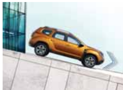
POMOĆ PRI KRETANJU NIZBRDO