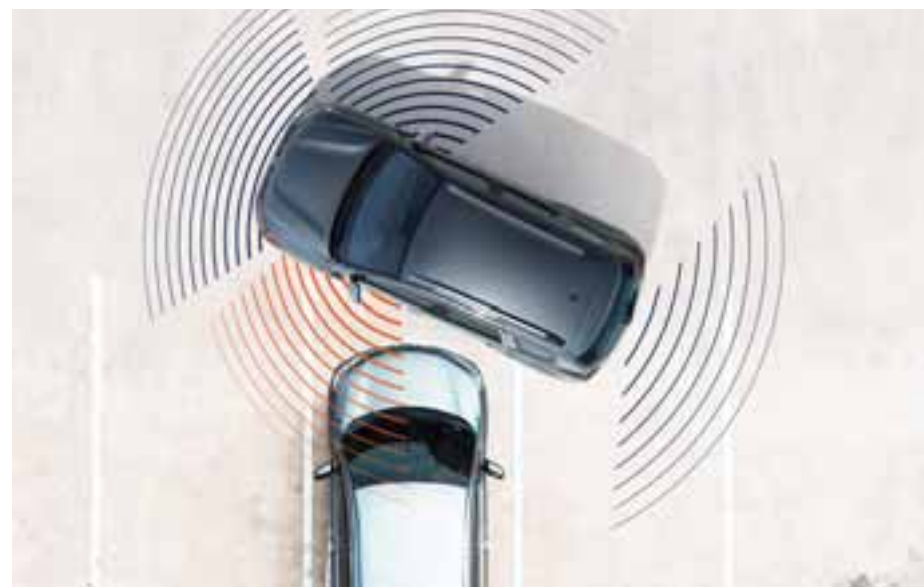
KAMERA ZA PRIKAZ IZ VIŠE KUTOVA