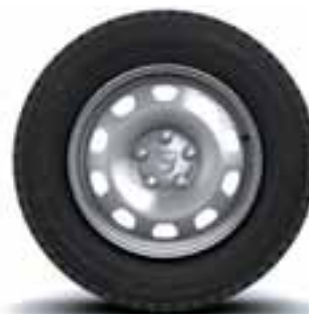
NAPLATCI 16" TÔLE