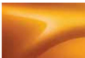
NARANČASTA ATACAMA (EDY)