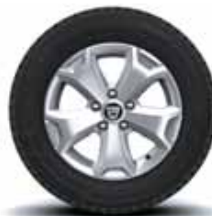
NAPLATCI 16" CYCLADE