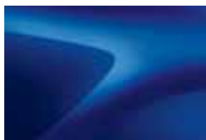
IRON PLAVA (RQH) (1)