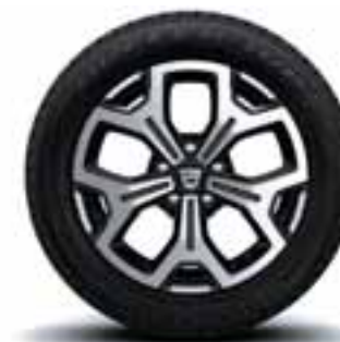
NAPLATCI 17" MALDIVES