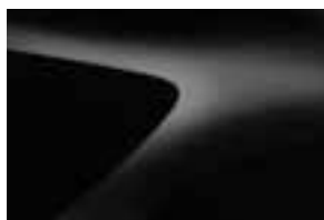
BISERNO CRNA (676)