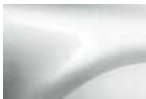
LEDENO BIJELA (369)